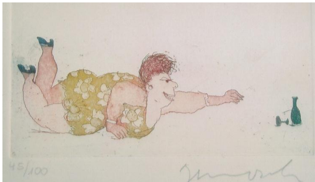
„nur ein Gläschen...“ /Farbradierung